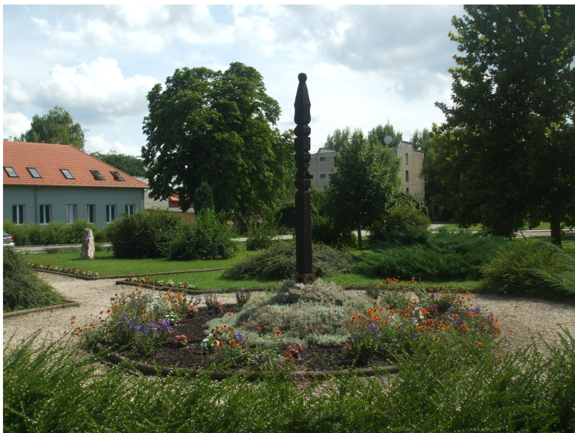
Kopjafa a Millenniumi Parkban, háttérben a Városháza új szárnya

1. Az értéktárba felvételre javasolt nemzeti érték fényképe vagy audiovizuális-dokumentációja