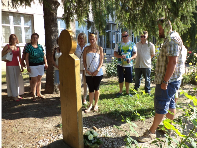
A középiskola előkertjében, a főbejárat mellett található emlékoszlop