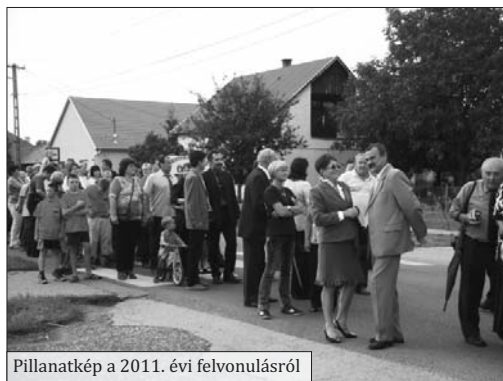
Pillanatkép a 2011. évi felvonulásról

17.30 A képviselő-testület és a civil szervezetek felvonulása a pusztaszabolcsi lovasok közreműködésével /Tűzoltószertár, Velencei út, Városháza, Templom, Művelődési Ház útvonalon/