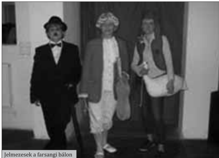
Jelmezések a farsangi bálon

módon körültekintően járjanak el, mert a fent említett események többsége szándékos gyűjtogatás volt. A mezőgazdasági és zártkerti égetésekről szóló hatályos jogi szabályozásokat megtalálják a www.szabolcsote.hu internetes oldalon is.