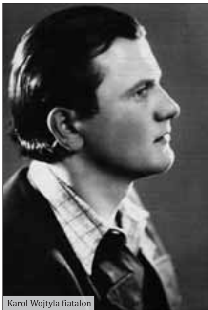
Karol Wojtyła fiatalon

széves, egyetemre jár, Hanjával, szerelmével együtt. Évfolyamtársaikkal együtt keresik a lehetőségét, hogyan állhatnának ellen a gonosznak. A többség a fegyveres harcot választja, s noha kezdetben Karol is azt tervezi, hogy belép a seregbe, végül Hanjával együtt egy földalatti, hazafias műveket előadó színház tagja lesz. Vallja, hogy a jövőt csak úgy építhetik fel újra, ha megőrzik a lengyel nép kulturális múltjának értékeit. A háború borzalmaitól szenvedő Karol harcolni szeretne, de érzi, képtelen erőszakhoz folyamodni. Kétségei közepette találkozik egy szabómeszterrel, aki beszélgetésük során Keresztes Szent János szavait idézi: a rosszat egyedül imádsággal és szeretettel lehet legyőzni. Ha nem így teszünk, hanem erőszakkal küzdünk ellene, elmegy ugyan, de visszajön más, sokkal félelmetesebb alakban. Mélyen megérinti és élete végéig elkíséri ez a gondolat a fiatal Wojtylát. Segíteni akar honfitársain, enyhíteni fájdalmukon, reményt és szeretetet adni nekik. Egy nap megérti, hogy erre a legmegfelelőbb eszköz, ha pap lesz.