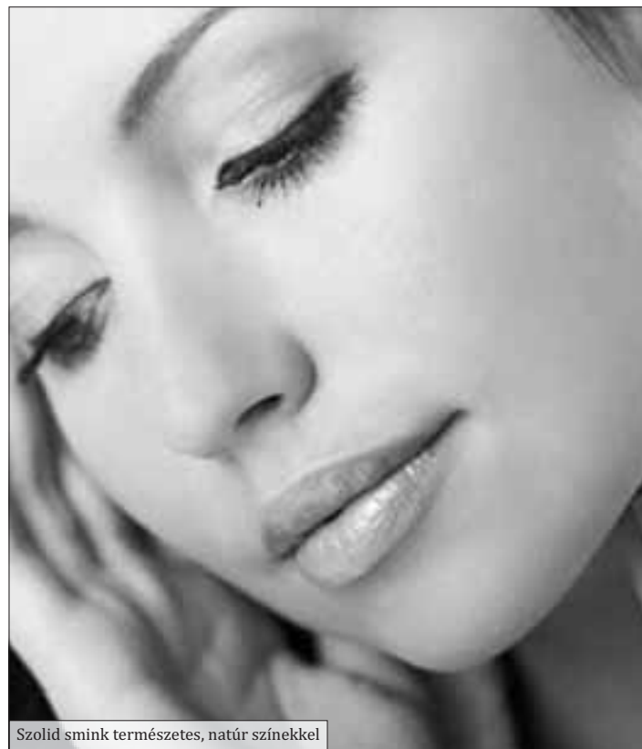
Szolid smink természetes, natúr színekkel

Az élénkvrös rúztól, a füstös szemhéjfestésen keresztül a mély-bordó ajkakig minden divat lesz.