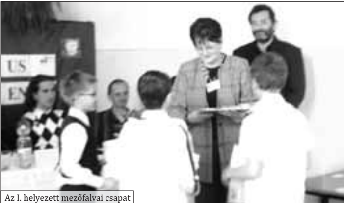
Az I. helyezett mezőfalvai csapat