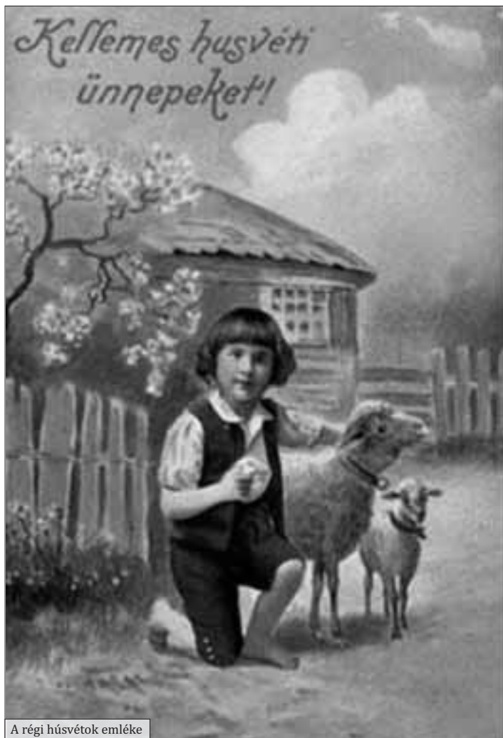
A régi húsvétok emléke

A régi ház körül öregszen minden, A kert, a fák, a fal, a bútorok. A régi ház körül nagy élet nincsen, Sokáig zörgetem az ablakot