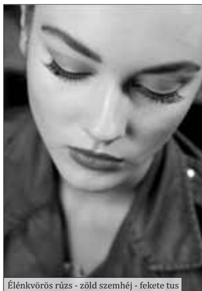
Élénkvrös rúzs - zöld szemhéj - fekete tus

Közeledik a legszebb évszak, a tavasz! Azon túl, hogy ennek nagyon örülünk, felmerülhetnek bizonyos kozmetikai problémák, amelyekről nem árt beszélnünk.