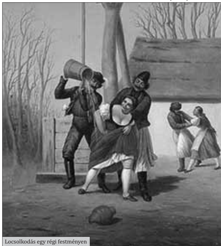
Locsolkodás egy régi festményen