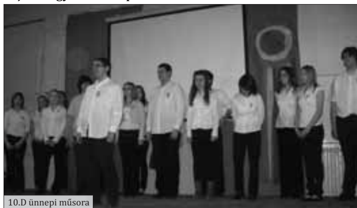
10.D ünnepi műsora

Mindenki kivette a részét a munkából, ráadásul osztályonként sütni kellett egy-egy tál pogácsát. Nagyon finomak lettek, a zsűrinek irigylésre méltó, de nehéz munkája volt. Évfolyamonként összesítette a zsűri az eredményt, a 4. helyezett a 11. évfolyam, a 3. helyezett a 10. évfolyam, a 2. helyezett a 9. évfolyam lett, és az első helyezést a nagy rutinnal rendelkező 12. évfolyam érte el. A „Legjobb film”-ért járó tortát a 9.A-8.D nyerte a Star Wars c. filmjével, a „Legjobb színdarab”-ért járó tortát a 12.D nyerte, ők az Avatar: Aang legendájából adtak elő egy mesejelenetet a színpadon. A „Legjobb tánc” kategóriát a 11.A osztály nyerte meg, Lady Gaga: Alejandro c. számára táncoltak, amivel beneveztek a Fejér Megyei Diáknapokra.