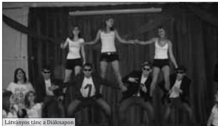
Látványos tánc a Diáknapon

A Diákönkormányzati nap témája a különböző korok, és azok bemutatása táncon, színdarabon és filmen keresztül. A szakközépiskolás és a gimnazista tanulók évfolyamonként együtt dolgoztak csapatokban. Sorsolás útján dőlt el, hogy melyik évfolyamnak melyik kort kell bemutatni. A 60'-70'-es éveket a 9. évfolyam (Film: Csillagok háborúja, Színdarab: Mézga család, Tánc: Karel Gott: Karneval), a 80'-90'-es éveket a 10. évfolyam (Film: Knight Rider, Színdarab: Macskafogó, Tánc: Kaoma: Lambada), a napjaink kategóriát a 11. évfolyam (Film: Barátok közt, Színdarab: Madagaszkár, Tánc: Lady Gaga: Alejandro), és a jövő témáját a 12. évfolyam (Film: Star trek, Színdarab: Avatar: Aang legendája, Tánc: Nox: A jövő zenéje) dolgozta fel.