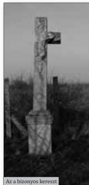
Az a bizonyos kereszt