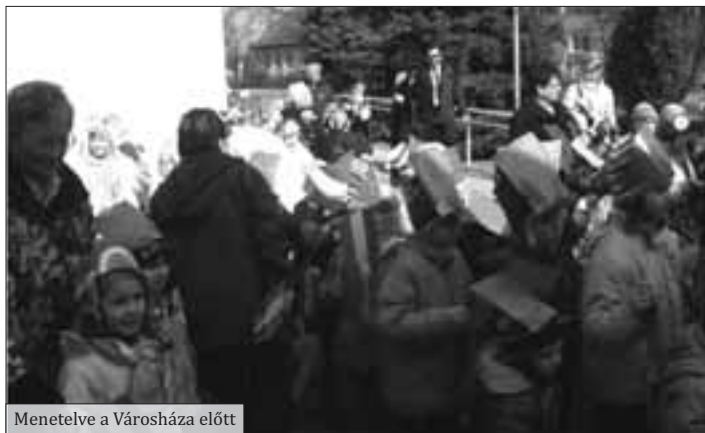
Menetelve a Városháza előtt

Március 11-én, pénteken verőfényes napsütésben vonultunk a Városházához, hogy kitűzzük a gyerekek által barkácsolt zászlóinkat, kokárdáinkat az 1848-as emléktáblához.