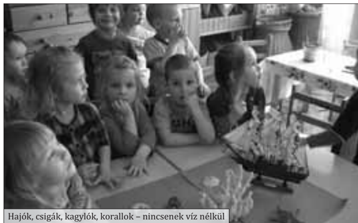
Hajók, csigák, kagylók, korallok – nincsenek víz nélkül

Idén is lehetőségünk nyílt vízsűrő berendezés megtekintésére, így kicsik és szülei is tisztított vizet kóstolhattak.