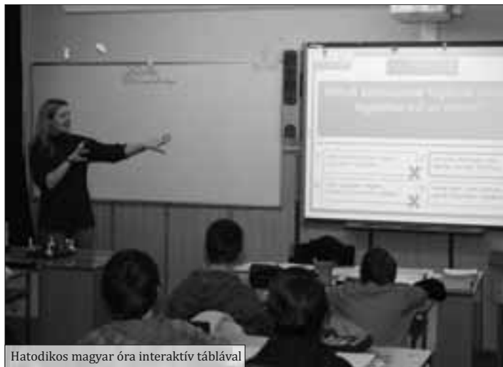
Hatodikos magyar óra interaktív táblával