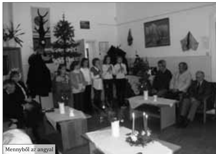
Mennyből az angyal

Kistérségi Szociális Központnak, hogy ha szerényen is, de hozzájárultak a karácsonyi ünnepségünkhöz.