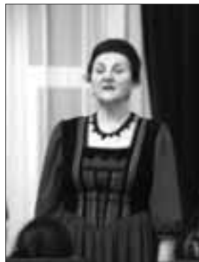
„Hol a mi hazánk? Kik vagyunk mi? És ki vagyok én?”

Rettenetes volt, hosszú időre boldogtalanná tett a gondolat, hogy mi nem vagyunk otthon. De, hát hol lennénk mi otthon? Hol a mi hazánk? Kik vagyunk mi? És ki vagyok én? Sok-sok