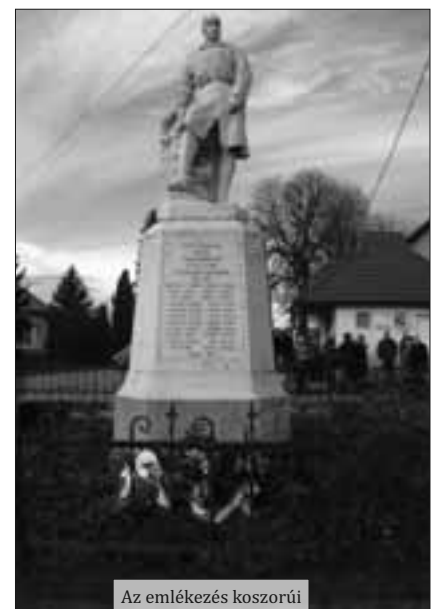
Az emlékezés koszorúi