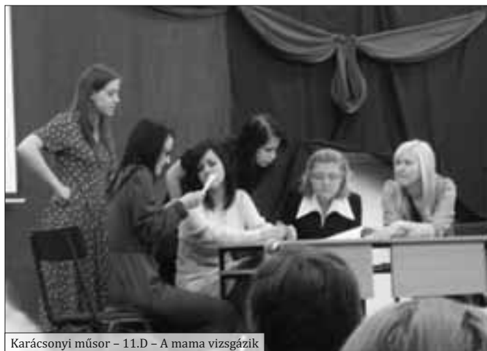
Karácsonyi műsor – 11.D – A mama vizsgálzik