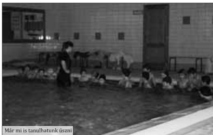
Már mi is tanulhatunk úszni

Néhány osztálynak jól kezdődött a II. félév. Január 18-án 7.30-kor az 1.b osztály úszni indult az iváncsai uszodába. Ők voltak az elsők, akik dupla testnevelés óra keretében megkezdheték az úszástanulást. Iskolánk heti 5 órát kapott. Ez azt jelenti, hogy 5 osztály fog hetente úszni előreláthatólag 9-10 alkalommal. Utána másik öt csoport kap lehetőséget.