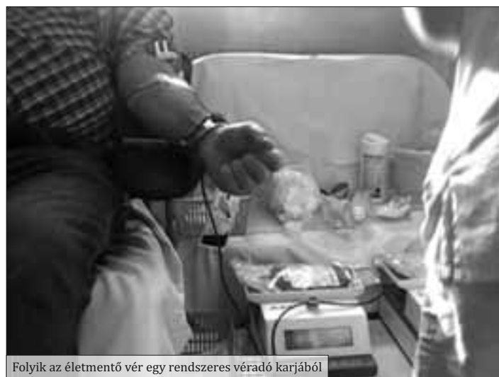
Folyik az életmentő vér egy rendszeres véradó karjából

Köszönöm a város lakóinak, hogy minden véradáson ilyen szép számmal részt vesznek és segítenek.