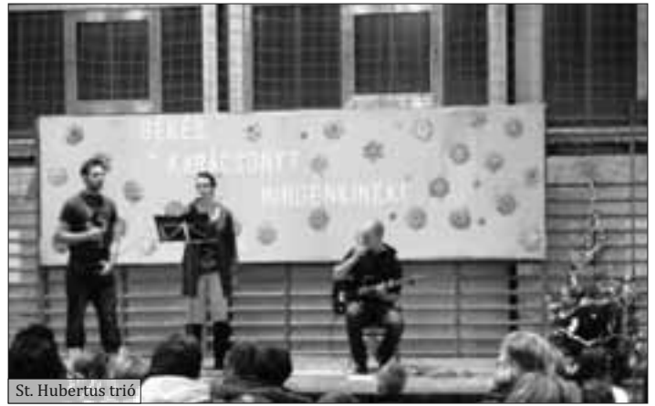
St. Hubertus trió