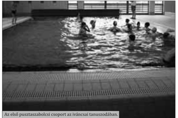
Az első pusztaszabolcsi csoport az iváncsai tanuszodában.

Ezt követően lényegesen csökkennek a fenntartási költségek, és az önkormányzatoknak már csupán ezt kell finanszírozni. Ezen intézkedésnek köszönhető, hogy rendkívül gyors szervezést követően január 18-án már az első csoportok – iskolások és óvodások – mehettek úszásoktatásra Iváncsára.