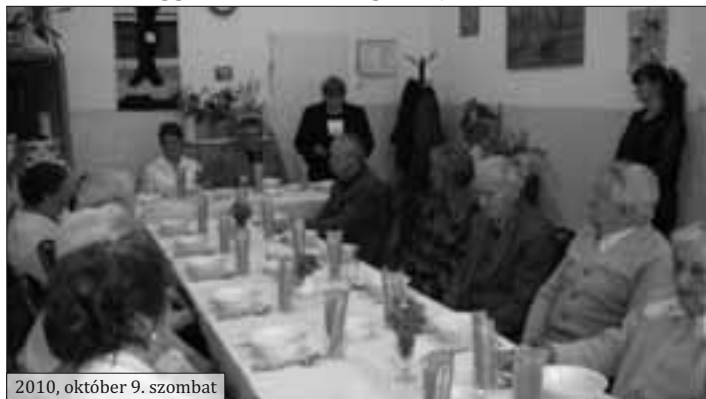
2010, október 9. szombat

Az Idősek Klubjában immár tíz éve minden évben megünnepeljük az Idősek Világnapját. Tavalyi évben is a dolgozók már szeptember elején azon gondolkodtak, mi legyen az ünnepi menü és ki milyen süteményt süssön. Az általános iskolásokat megkértük, készüljenek egy rövid műsorral... Mikor mindent megbeszéltünk, szóltunk az intézményvezetőnek, ő azt mondta, írjunk össze mindent, ami kell, és majd segít bevásárolni. Megtettük. Az időpontot is kitűztük október 9. szombatra. Hétfőn eljött hozzánk az intézményvezetőnk és közölte, Kistérségi Társulásnak nincs pénze az ünnepségre, próbáljunk támogatókat keresni. Nagyon csalódtunk, mert ilyen még nem volt, de ezt is megtettük. Október 9-én reggel minden dolgozó jött, hozta az otthon