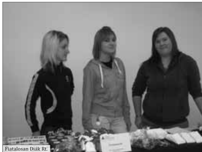
Fiatalosan Diák Rt.