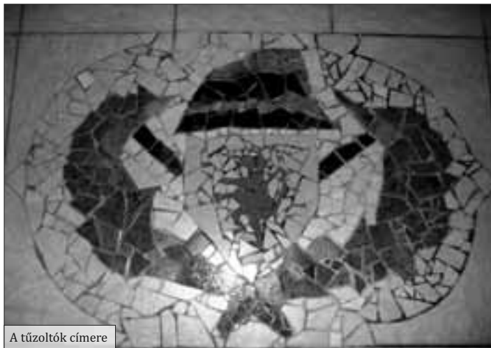
A tűzoltók címere

A nyár folyamán udvarrendezéssel, virágszaggal, az erkély korlátain nyújtózkodó növényekkel szépítettük szertárunkat.