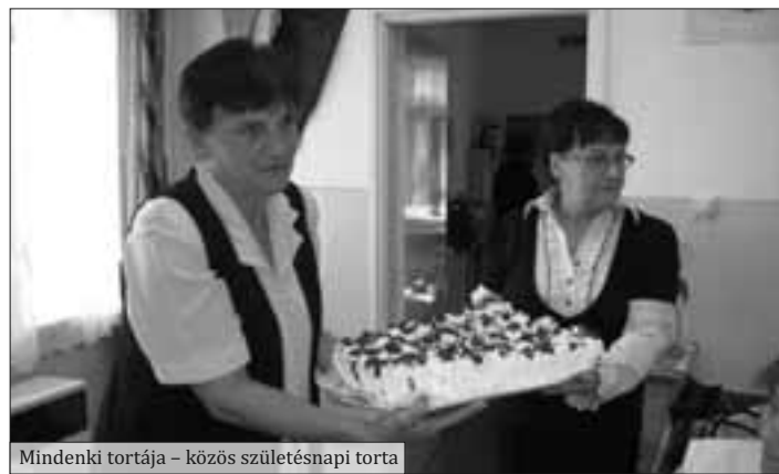
Mindenki tortája – közös születésnap tortája