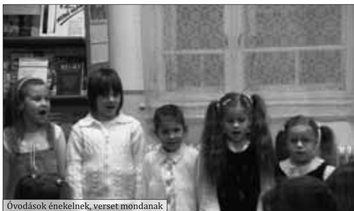
Óvodások énekelnek, verset mondanak

A Himnusz eléneklése után a legkisebb olvasni vágyók énekeltek, s mondtak verseket folyókról, s utazásra vivő