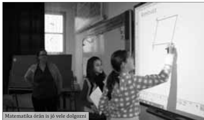
Matematika órán is jó vele dolgozni

Örömhír az is, hogy működnek iskolánknak az interaktív táblák, és megérkeztek a tanulói laptopok. Lapunk előző számában megjelent mindkét nyertes pályázat részletes leírása. Tíz interaktív tábla közül 3 db alsós tanteremben, 7 db felsős szaktanteremben került elhelyezésre. Az érintett tanítók és szaktanárok megkapták a laptopokat. Kiépült a WIFI rendszer, mely lehetővé teszi az internet használatát. A pedagógusoknak szakmai kihívás, a gyerekeknek nagy öröm a táblák használata. A 23 db tanulói laptopot egy felsős osztály vette birtokba.