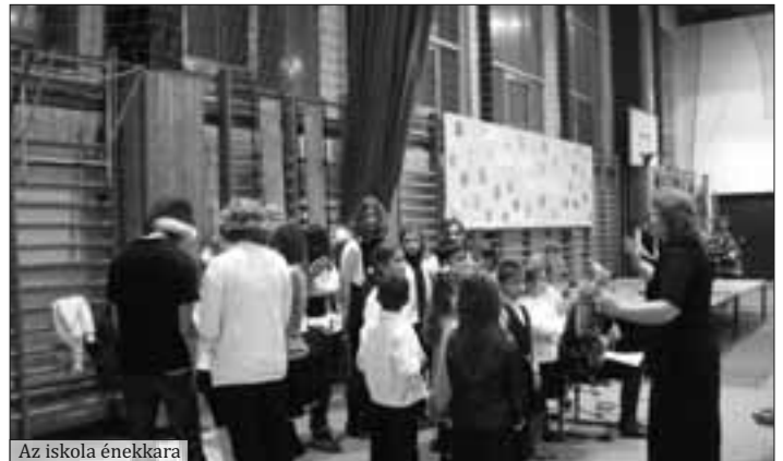
Az iskola énekkara

Köszönet az iskolavezetésnek, hogy helyet adott a városi karácsonynak; az iskola dolgozóinak a segítségért; a közterület felügyelőnek és a közmunkásoknak a szállításért és a cipekedésért. Nélkülük, a háttér nélkül nem jöhetett volna létre ez az este sem.